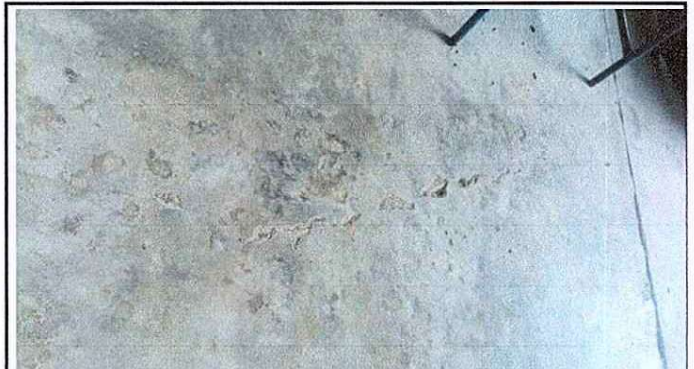
Foto 2: Se observa del deterioro del piso del aula del establecimiento en el modulo 1.