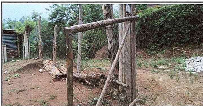
Foto 5: se observa el deterioro de la circulación del muro perimétrico en el modulo 3.