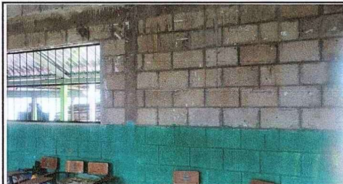
Foto 3: Se observa el deterioro de la pared sin repello en el modulo 1.