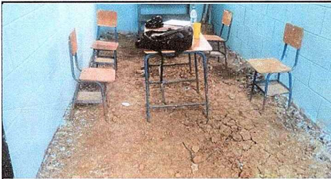
Foto1: Se observa la dirección del establecimiento sin piso en modulo 1.